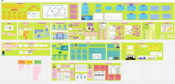
Imagem 1 – Quadro elaborado pelas residentes

Relato de experiência sobre as atividades desenvolvidas na Residência Multiprofissional de Gestão dos Serviços em Saúde e Redes de Atenção à Saúde em um hospital filantrópico da capital de São Paulo, Brasil, no período de julho de 2022.